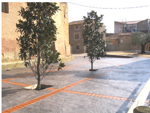
Estado casi finalizado de la plaza

El proyecto de dicha obra detalla que se ha optado por conseguir un espacio destinado a plaza con una superficie lo más plana posible en la que se puedan desarrollar actividades culturales y lúdicas de todo tipo. Se mantiene el abrevadero, como elemento recordatorio de tiempos pasados. El terminado de la plaza será con adoquín cerámico, en la de F. Muñoz y Serrano del Castillo, y de hormigón impreso en la plaza de Los Pilares. Los encuentros con las calles adyacentes se dejarán sin resaltos con el fin de permitir la buena circulación de viandantes y personas con dificultades agudas de movilidad. La superficie colindante a la entrada principal de la iglesia será cerrada al aparcamiento de vehículos a motor, mediante bolardos escamoteables, siendo retirados cuando las circunstancias así lo exijan. De igual manera, en el perímetro de la iglesia se colocarán una serie de farolas que iluminarán, de abajo a arriba el edificio religioso lo que sin