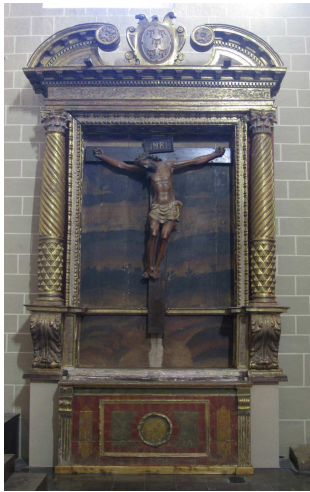
Antes de la restauración