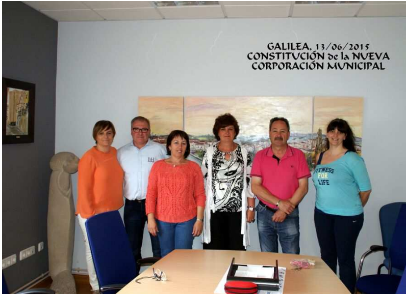
CONSTITUCIÓN DE LA NUEVA CORPORACIÓN MUNICIPAL