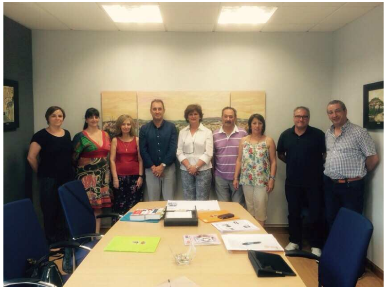
PRIMER PLENO MUNICIPAL DE LA NUEVA LEGISLATURA

Este es el equipo que trabajaremos con ilusión para seguir manteniendo nuestro pueblo para que siga siendo un Pueblo para Vivir .